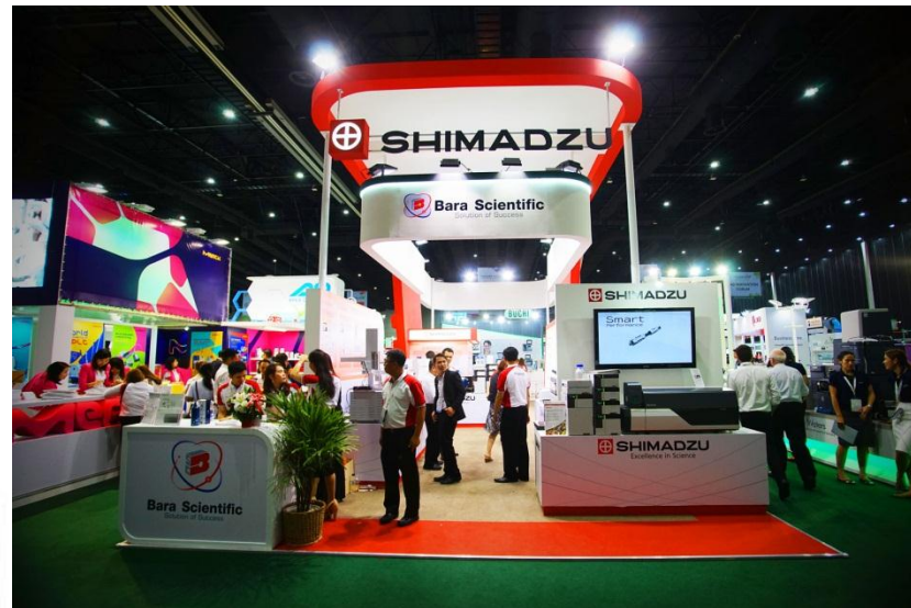
IMAGE N.T.C. IMAGE CREATION FOR SUCCESS EXPOSING YOUR WORLD GO BEYOND IMAGINATION