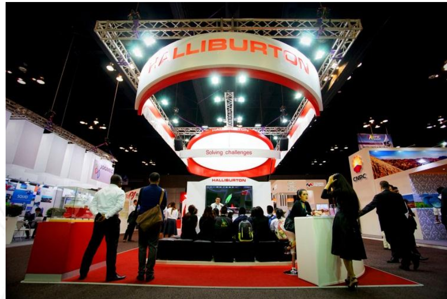
IMAGE N.E.C. IMAGE CREATION FOR SUCCESS EXPOSING YOUR WORLD GO BEYOND IMAGINATION