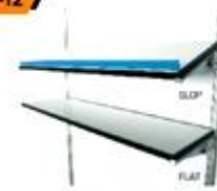
Wall Shelf 25X100 cm.