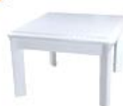
Coffee Table 65X85X40 cm.