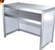
Counter 50X100X75 / 100 cm.