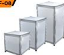
Display Stand 50X50X50 / 75 / 100 cm.