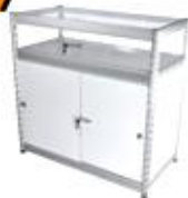
Counter Showcase 50X100X100 cm.