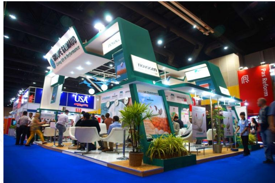
IMAGE N.E.C. IMAGE CREATION FOR SUCCESS EXPOSING YOUR WORLD GO BEYOND IMAGINATION