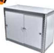
Lockable Cabinet 50X100X75 cm.