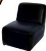
Lounge Chair (Sofa) 60X80X40 / 70 cm.