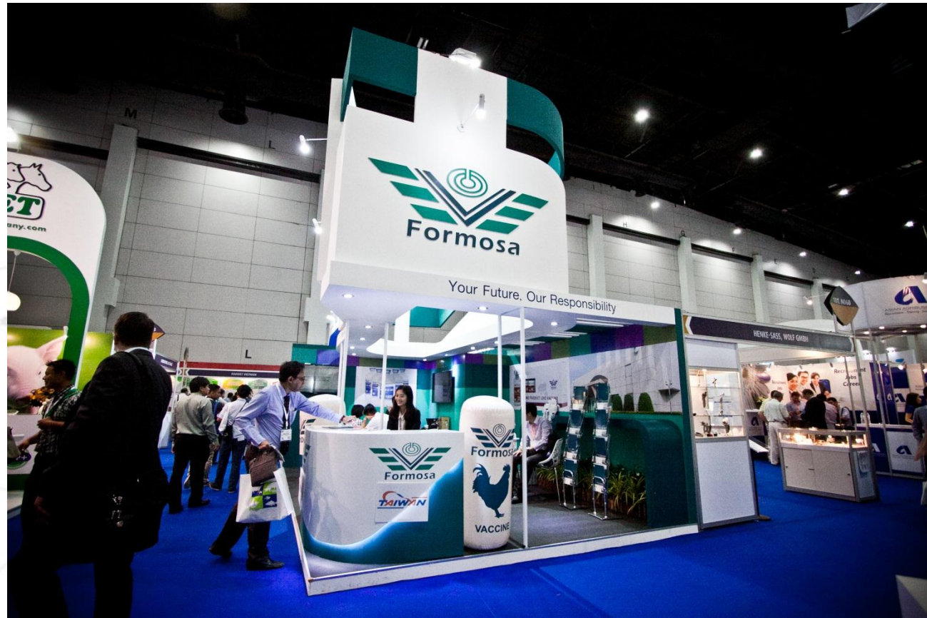
IMAGE N.E.C. IMAGE CREATION FOR SUCCESS EXPOSING YOUR WORLD GO BEYOND IMAGINATION