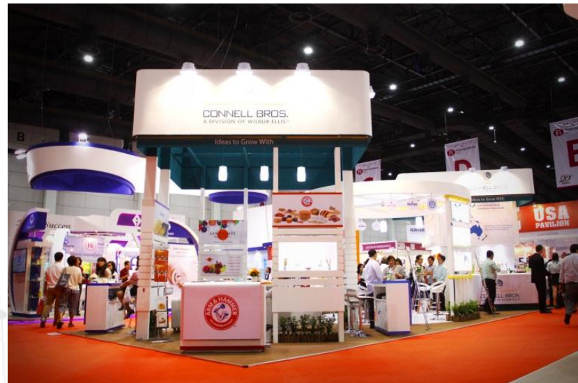
IMAGE N.C. IMAGE CREATION FOR SUCCESS EXPOSING YOUR WORLD GO BEYOND IMAGINATION