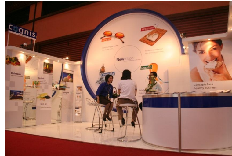
IMAGE N.E.C. IMAGE CREATION FOR SUCCESS EXPOSING YOUR WORLD GO BEYOND IMAGINATION