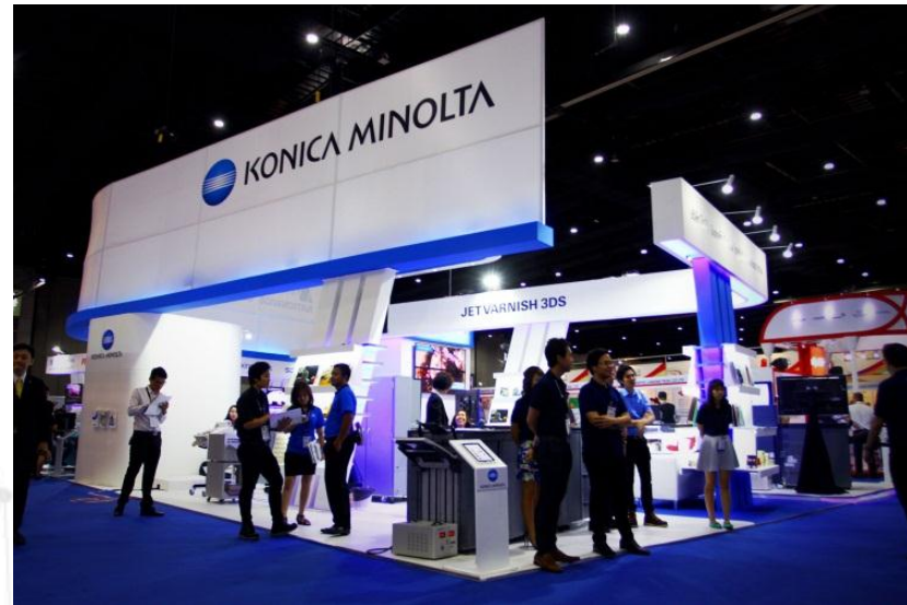
IMAGE N.E.C. IMAGE CREATION FOR SUCCESS EXPOSING YOUR WORLD GO BEYOND IMAGINATION