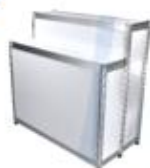
2 - Tier Counter 50X100X100 / 120 cm.