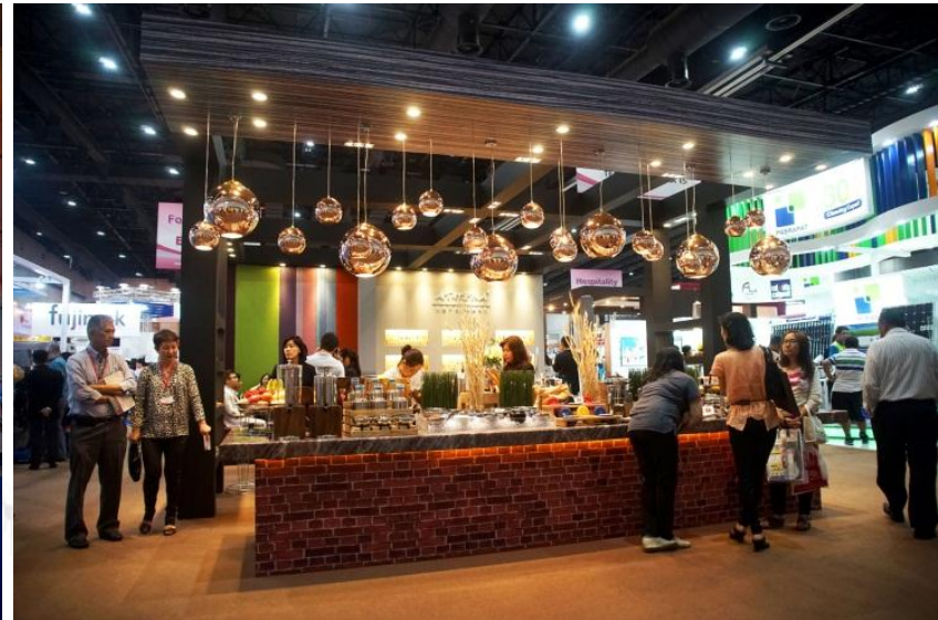
IMAGE N.E.C. IMAGE CREATION FOR SUCCESS EXPOSING YOUR WORLD GO BEYOND IMAGINATION