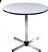
Round Table 75X75X75 cm.