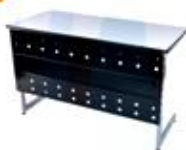
Receptionist Desk 60X120X75 cm.